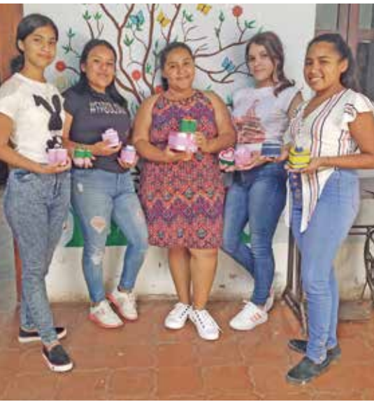
Eindrücke aus der Casa entre nosotras

die Woche käme und sich mit den Menschen beschäftigte.