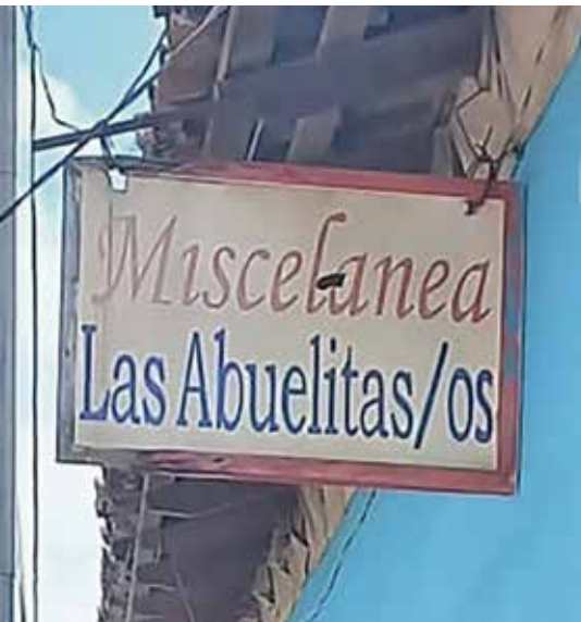
Ein Herzenswunsch: Das Lädchen

bürokratische Hürden zu nehmen. Viel hängt z. B. von den zweimonatlich erforderlichen Genehmigungen des Innenministeriums ab. Als – wie geschehen – die Genehmigung nicht rechtzeitig erfolgte, konnten für zwei Monate keine Löhne gezahlt werden. Dies führte zu drei Kündigungen, weil die Mitarbeiterinnen diesen Zeitraum nicht eigenständig überbrücken konnten.