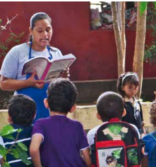
Kinder- und Jugendbibliothek

Mit dem Bus ging es dann nach Ocotal. Wenn man in unserer Partnerstadt durch die Straßen läuft, stellt man fest, dass sich viel positiv verändert hat: Die Häuser sind gepflegter, die Straßen sauberer, aber auch voll von verrückten Motorrad- und AutofahrerInnen. Auffällig und erfreulich ist auch, dass Frauen mehr Respekt entgegengebracht wird: Es wird ihnen weniger nachgepöffelt und die Anzahl der Macho-Sprüche hat abgenommen.