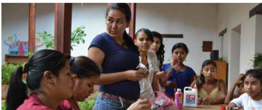
Blick in die Casa Entre Nosotras, siehe auch Seite 4

Unsere vorwiegend aus Frauen bestehende »Eine-Welt-Handelsgruppe« entschied, die Spenden und Überschüsse aus unserer Arbeit dieser Einrichtung in Ocotal zukommen zu lassen. Das geschieht noch immer und leider ist es auch immer noch notwendig. Diesbezüglich bildet, wie wir alle wissen, Ocotal keine Ausnahme auf der Welt. Deshalb hoffen wir, unser Fair-Handels-Projekt noch recht lange fortführen zu können.