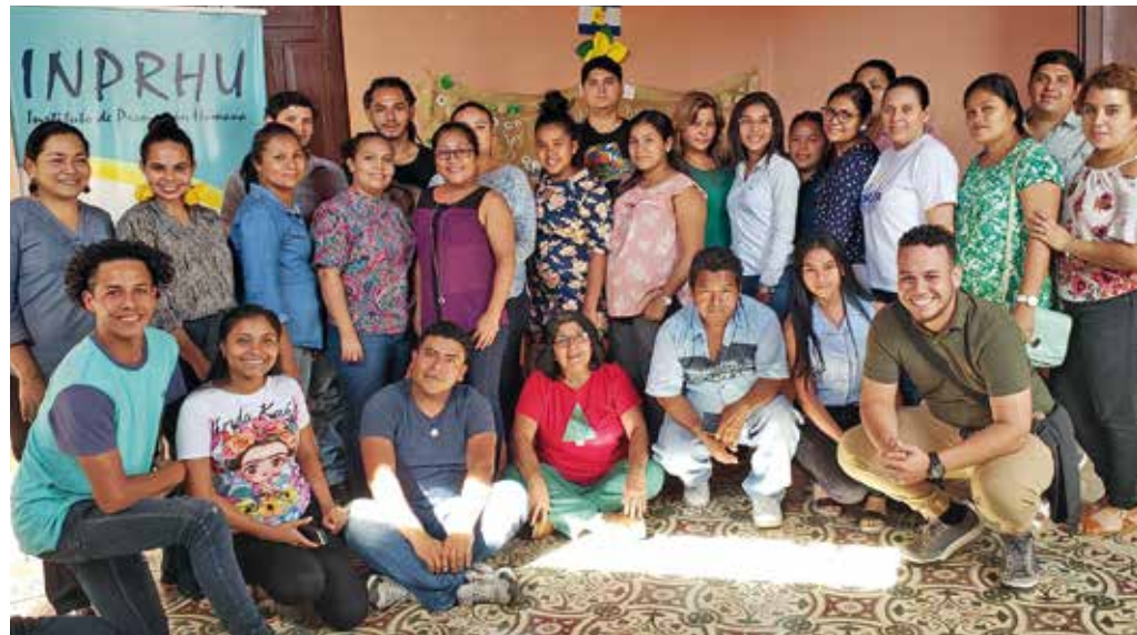
Das Team unserer Partnerorganisation INPRHU

Alle Plätze im Haus sind belegt und eigentlich wäre mehr Personal erforderlich. Sehr hilfreich wäre es, eine Krankenpflegerin oder einen Krankenpfleger im Haus haben. So müssen die Mitarbeiterinnen auf sich allein gestellt die Gesundheit der Alten im Auge haben, wofür ihnen aber häufig die medizinischen Kenntnisse fehlten. Und in dem Raum, in dem die Pflegekraft sich aufhalten würde, könnte ein Bett für Kranke stehen. Das Bett wurde gekauft,